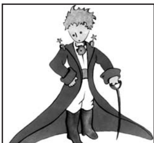
Маленький принц. Рисунок Антуана де Сент-Экзюпери.

Сент-Экзюпери есть только в Японии и Южной Корее. Во Франции ведутся работы по созданию музея в замке Сен-Морис, близ города Лиона, где прошло детство писателя. Таким образом, Центр может стать важным пунктом в музейном маршруте, связанном с именем автора "Маленького принца".