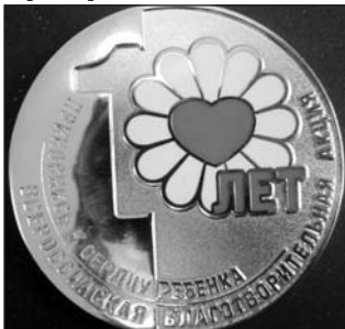
Президент Общероссийской общественной органи-

Ректор УлГУ удостоен награды за большой вклад в реализацию благотворительных программ.